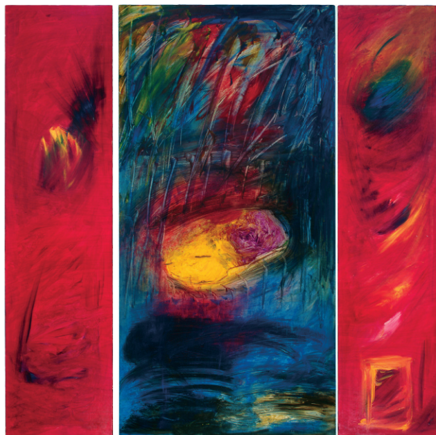
© Daniel Leblond, Compassion , huile sur bois, triptyque, 122 x 122 cm (ouvert), 2004

En 2011, le CJF a d'ailleurs pris un virage important en ce qui concerne les nouveaux moyens de communication. Son site Internet ( www.cjf.qc.ca ) a été entièrement renouvelé, et reflète davantage l'engagement du Centre dans de nombreuses causes, les collaborations qu'il tisse et son rayonnement croissant, entre autres dans les médias. Le CJF et Relations sont aussi maintenant présents dans les médias sociaux pour rejoindre un public plus vaste et diversifié. >